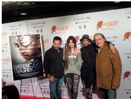
Op de rode loper van LALIFF (Los Angeles Latino Film Festival)